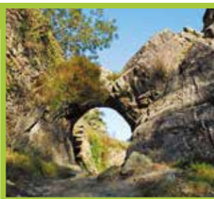
Le Pas de Roland

Le long d'un sentier muletier longeant les gorges d'Ateka et la Nive, un étroit passage taillé dans la roche relie la vallée à la ligne frontrière. Des légendes qui lui sont attachées, ce passage a gardé le nom de « Pas de Roland ». Pour certains, Roland, neveu de Charlemagne, se rendant à Roncevaux combattre les Sarrasins (en réalité les Basques), se heurta à un rocher infranchissable. Son épée « Durandal » qui ne le quittait jamais, permit à Roland de tailler un passage pour ses soldats qui purent ainsi poursuivre leur chemin. Pour d'autres, cette brèche dans la roche serait le résultat d'une ruade du cheval de Roland. Quelle que soit la légende, le superbe paysage vaut le détour.