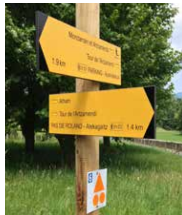
Signalétique des sentiers de randonnées

GRP®, GR® et PR® sont des marques déposées par la Fédération Française de Randonnée Pédestre. Certains itinéraires ont été sélectionnés par la Fédération Française de randonnée pédestre en fonction de critères de qualité, ils sont labellisés PR®.