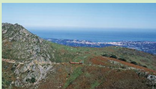
Vue sur l'océan depuis la Rhune

R andonnée qui vous permettra d'atteindre le sommet de la Rhune, où vous pourrez vous restaurer avant d'entreprendre la descente. Le panorama est exceptionnel.