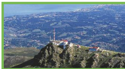
Sommet de la Rhune

La Rhune est un haut lieu de pâturages, comme en témoignent les nombreux cayolars (bergeries) aux toits de lauzes, ainsi que les troupeaux de brebis et pottoks. On peut accéder au sommet dans un petit train à crémaillère, au départ du col de St-Ignace.