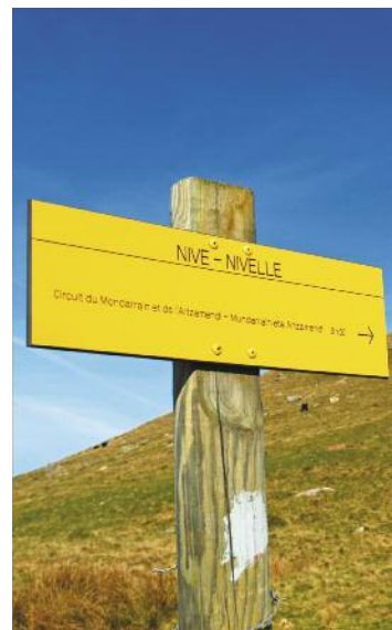
Une photo locale des sentiers ou balisage

Durée de la randonnée : La durée de chaque circuit est donnée à titre indicatif. Elle tient compte de la longueur de la randonnée, des dénivelées et des éventuelles difficultés.