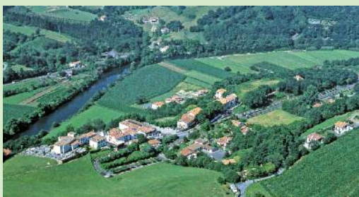
Vue aérienne de Biriadou

A partir du village de Biriadou, qui vaut à lui seul le détour, partez à l'assaut des collines basques. Outre les vues magnifiques sur le littoral, vous y ferez certainement la rencontre des pottoks, des brebis et des vautours fauves.