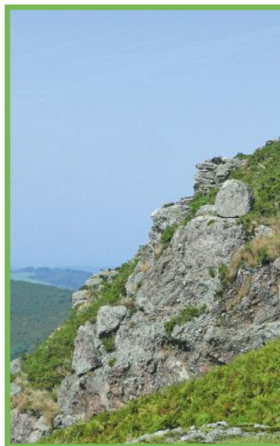
Rocher des Perdrix