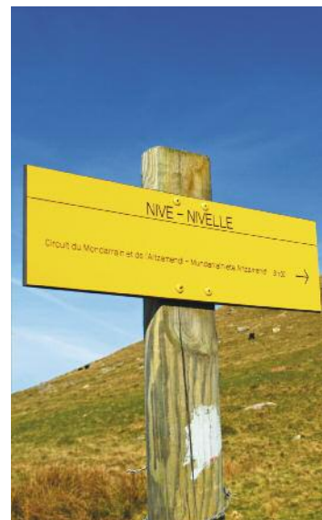
Une photo locale des sentiers ou balisage

Durée de la randonnée : La durée de chaque circuit est donnée à titre indicatif. Elle tient compte de la longueur de la randonnée, des dénivelées et des éventuelles difficultés.